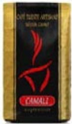
Tueste Artesano Gourmet