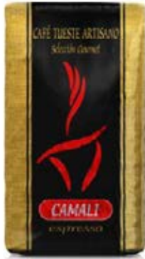
Tueste Artesano Gourmet