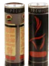
CAMALI PREMIUM molido o en grano